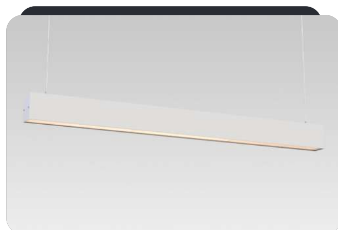
ПРИМЕР СВЕТОВОЙ ФИГУРЫ